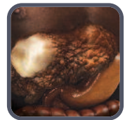
Cáncer de hígado